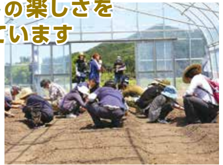
◀▲ ビニールハウスでベビーリーフの種まき