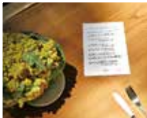
本日の料理 メニュー