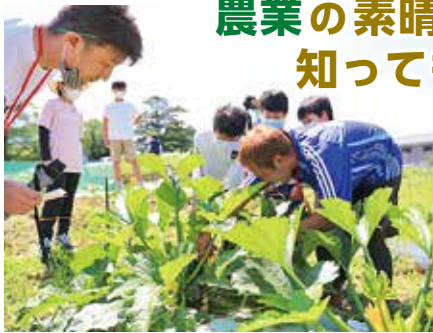
ズッキーニの収穫 ▲▶