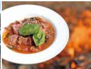
野菜だけで作ったスープ さすがイタリアンのシェフ