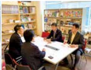
現在は東急ハンズ（写真手前2人）が経営受託者