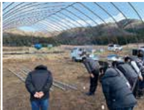
ビニールハウス上棟式 美味しい野菜が採れますように