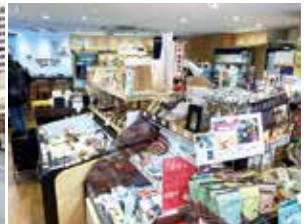
ショップの中は普通の物産館です