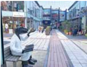
奥のれんのある店がアンテナショップ（南青山291）

今回の議会でアンテナショップの今後の方向性案が出され、南青山は物販を取りやめ、食体験としてレストラン形式で転貸しする方針、銀座の方は店舗面積が狭いため、日本橋か銀座で新たな場所への立地を模索していくようです。私は、この大切な公共空間を県民に対し公共施設としての役割を明示し、県の「アンテナショップ」として費用対効果がしっかり見えるように示すべき、と2月議会で一般質問しました。