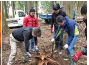
整地に向け根を掘り上げ