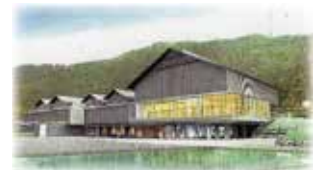
一乗谷ミュージアム 完成イメージ