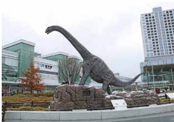
駅前次は南条サービスエリアに設置？ 県内の主要な場所に恐竜を置く目的が分からない…。

答弁 中京・関西からの玄関口である南条SAの恐竜モニュメントの設置は、地元からも大変好評を得ている。恐竜博物館のゲートウェイと位置付け、来館者を迎えるモニュメントを設置したい。恐竜モニュメントの設置に当たっては各市町とも設置場所を十分協議しながら、恐竜博物館が監修するリアルさにこだわり恐竜博物館へ向かう途中から、非日常的な太古の世界への期待感を醸成し、「福井といえば恐竜」というイメージづくりを更に進めていきたい。