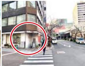
銀座店は人影も少なくアンテナショップの活気はない