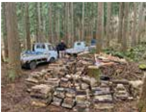
耐火レンガをいただき搬入 ピザ窯も作りますよ～